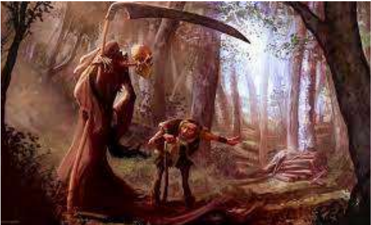
"PLUTÔT SOUFFRIR QUE MOURIR" (Thà sống khổ còn hơn là chết) La Fontaine